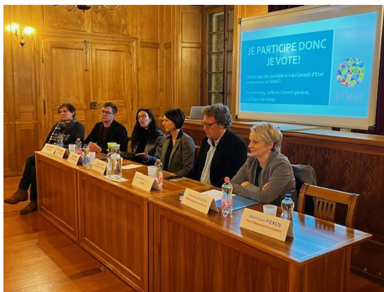
Ci-dessus, certain.e.s des candidat.e.s au Conseil d'Etat, en débat, le 13.03.2025 dans la salle du Conseil général de la Commune de La Chaux-de-Fonds.

Le rapport souligne l'importance de continuer ce type d'initiative à l'avenir, notamment pour réduire la non-participation démocratique et renforcer l'intégration politique active des populations immigrées dans le paysage social et politique neuchâtelois.