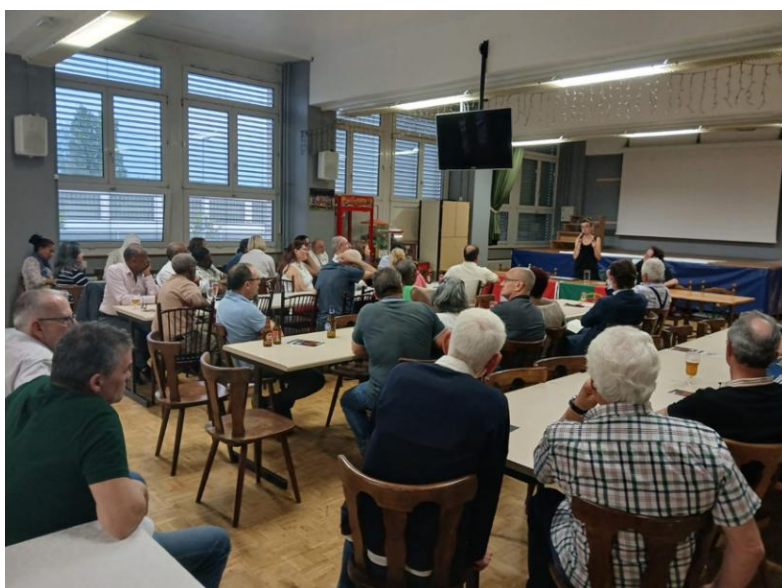
7 juin 2024 : séance d'information sur les prestations complémentaires, au Centre portugais de Monruz, Neuchâtel.